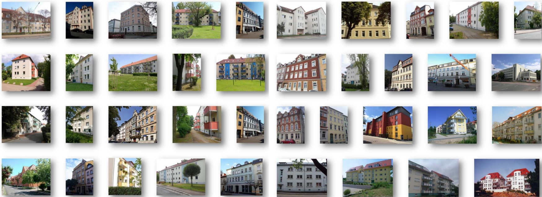
Einige Referenzobjekte aus 34 Jahren Vermietungstätigkeit.

Nutzen auch Sie unsere jahrelange Erfahrung bei der Mietersuche ! Wir freuen uns, Ihr Mietobjekt in unsere Vermarktung aufnehmen zu dürfen !